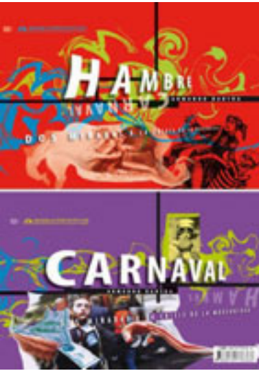
Dos miradas a la crisis de la modernidad , México, Universidad Autónoma Metropolitana, Unidad Xochimilco, 2013.

Dos miradas a la crisis de la modernidad es un libro suntuoso con pastas duras y papel fino donde cada página está cuidadosamente diseñada con tipografías e ilustraciones para cumplir con la “intuición grotesca, como el texto, [en] el discurso icónico del libro [que] entrevera imágenes de los más diversos orígenes”. La intención estética incluye notas organizadas por los temas tratados, tanto en la parte de ochenta páginas titulada “Hambre” como en “Carnaval”, de 160. Una sigue a la otra como reverso apreciable desde la portada y los interiores del libro-objeto, con encuadernación cosida, como evidencia el lomo. ▽