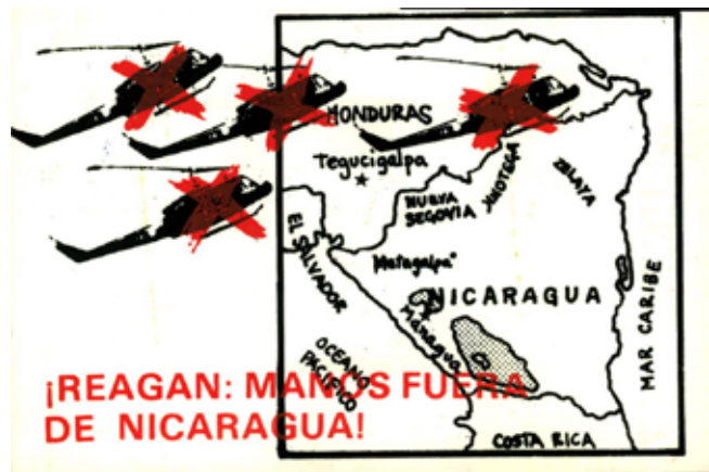
Colectivo Solidarte, Reagan: manos fuera de Nicaragua , 1983, postal 10 x10 cm, archivo CAEV.

En indudable que las concepciones y acciones de los artecorreístas adquieren sentido desde el horizonte ideológico-político, social y cultural que los configura