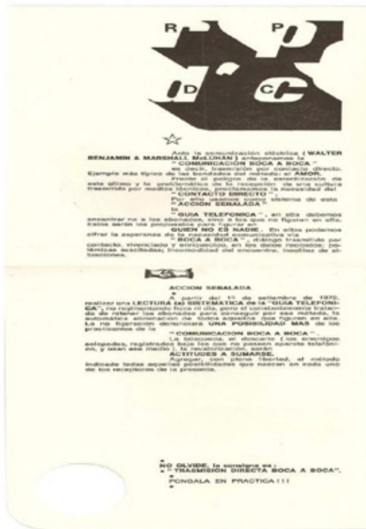
Edgardo Antonio Vigo, ¿Quién no es nadie? , 1972, tarjeta 10 x 15 cm. Archivo CAEV.

masas que dejaría así de ser una vulgarización de los conocimientos de los sabios”. 6 La referencia a Mattelart resume su postulado, orientado hacia la comunicación, el arte y la política mediante la redefinición del papel del artista, quien debe asumir el compromiso con la realidad circundante y, particularmente, con los que no tienen voz. El creador —ligado a la noción de intelectual orgánico de Gramsci—, siendo nexo entre la estructura y la superestructura, debe ponerse al servicio de la transformación social.