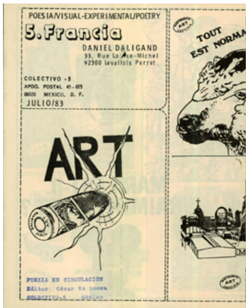
Colectivo 3, “Poesía en circulación”, 1983, volante de 10 x 30 cm.