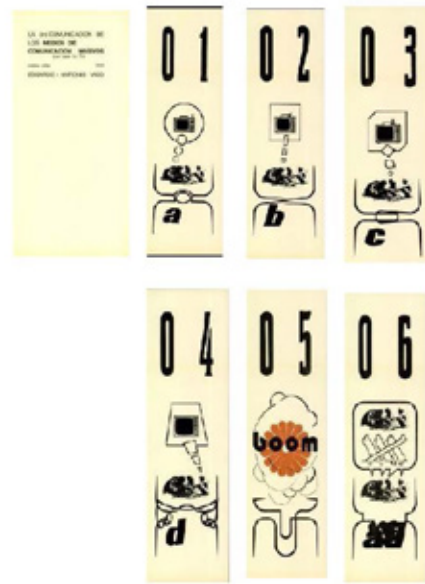
Edgardo Antonio Vigo, La (in) La comunicación de los medios de comunicación masivos (por caso la TV) , 1972, Hexágono 71 —be—.

Siguiendo esta línea, ¿Quién no es nadie? presenta un texto que se inicia con una proposición: “Ante la comunicación eléctrica (Walter Benjamin & Marshall McLuhan) antepone la COMUNICACIÓN BOCA A BOCA”. Esta declaración pone en diálogo a los intelectuales de la teoría crítica (Benjamin) y funcionalista (Mc Lu-