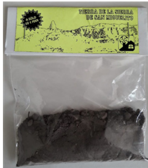
Taller Ventilador, Registro de tierra de la Sierra de San Miguelito a sólo 50 centavos , 2019.

La pieza propone la posibilidad de entablar una serie de lecturas sobre la dinámica que históricamente