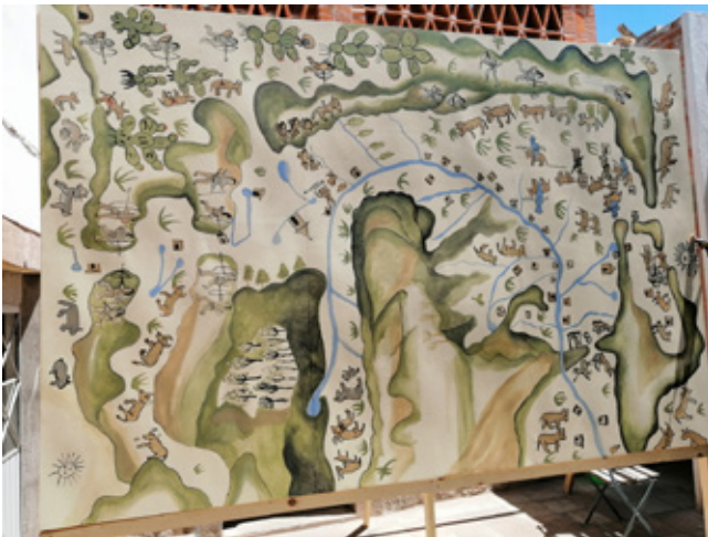
Registro de Y sin embargo, seguimos .

Las experiencias artísticas en cuestión permiten imaginar posibilidades, caminos, descolocar al espectador y llevarlo a dimensionar las consecuencias que puede tener un proyecto como el impulsado por las inmobiliarias. En un contexto local en el cual la ciudad y sus alrededores han sido víctimas sistemáticas de la imposición de proyectos extractivos que producen el despla-