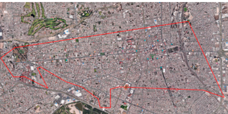
Polígono del proyecto 2 mil 64 hectáreas de Valeria Regil.