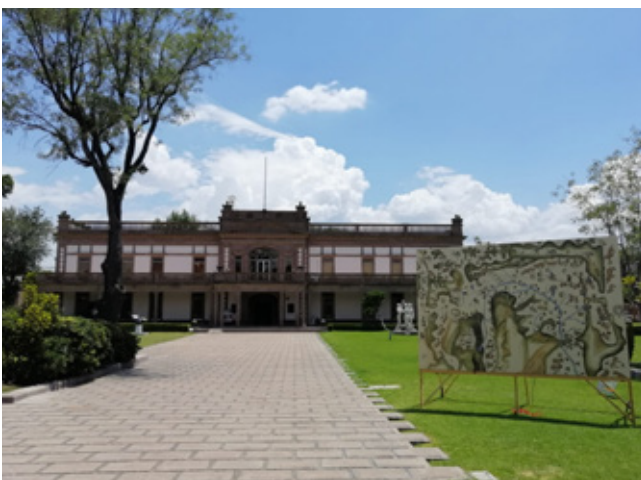
Registro de Y sin embargo, seguimos .

zamiento forzado de los habitantes de los espacios en disputa, y que lo único que logran es enriquecer a los grupos empresariales, la irrupción de estos proyectos artísticos supone una estrategia para visibilizar la problemática y concientizar a la población.