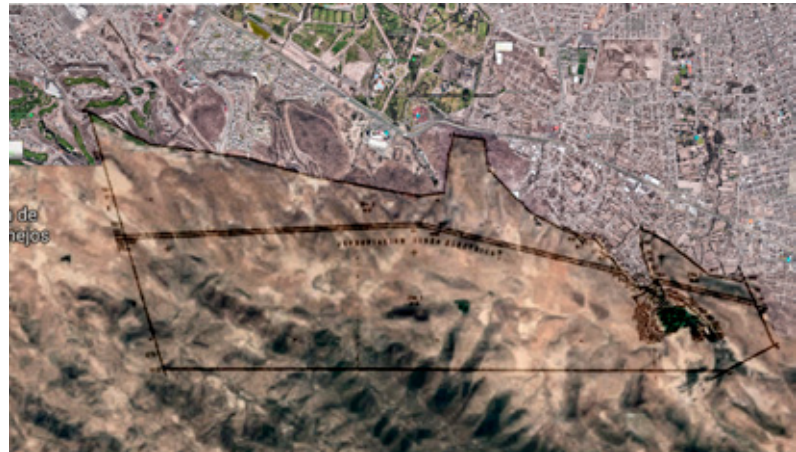
Polígono de las 2 mil 64 hectáreas que pretende adjudicarse el proyecto inmobiliario Reserva, fuente: Valeria de Regil.

Entre otras irregularidades, este proyecto carece del permiso de cambio de uso de suelo. Buscan comprar las tierras comunales a un valor de $83.63 el metro cuadrado con ganancias a los empresarios de 60 % y 40 %. 18 Al no contar con este permiso, el gobierno, en evidente complicidad, ha invertido alrededor de 13 millones de pesos en infraestructura hidráulica, pavimentación y drenaje dentro del territorio de Tierra Blanca perteneciente a la comunidad de San Juan de Guadalupe, obras que benefician al proyecto, y no sólo eso, incluso se ha elaborado un plan para convertir en