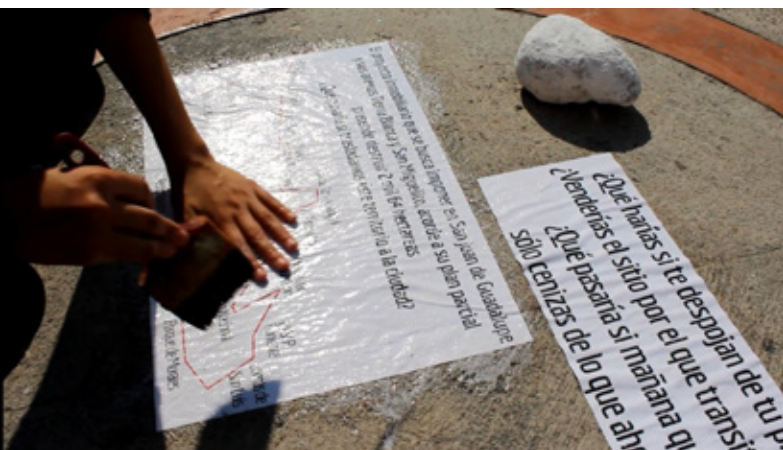
Registro en video de 2 mil 64 hectáreas de Valeria Regil, 2019, < >.