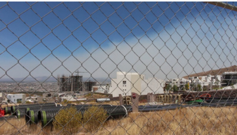
Nahúm Delgado, Marcha a la Sierra , 2019.

de Guadalupe, que asciende a los 30 millones de pesos, así como la responsabilidad de las autoridades municipales y estatales al permitir el uso y el abuso indiscriminado de los recursos humanos y naturales a través de tratos fraudulentos con los empresarios.