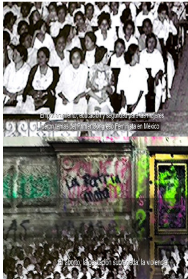
Ectopía . Fotogramas del ensayo visual.

Consideramos que nuestra gestión de los materiales audiovisuales, experienciales y poéticos respondió al objetivo de maximizar la comunicabilidad, comprensión y capacidad de afectar y generar solidaridades frente a una situación que no estaba siquiera en discusión en el espacio personal y familiar de las mujeres con quienes colaboramos, y que resulta muy significativo de la situación de muchas otras mujeres y hombres en la actual situación económica y productiva de Cuba.