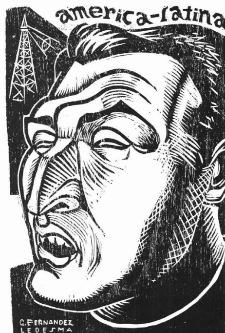
CABEZA DE HAYA DE LA TORRE, PARA LOS CARTELES QUE ANUNCIARON SUS CONFERENCIAS. (Reducida.)